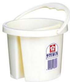
縦 140mm 横 140mm 高さ 110mm